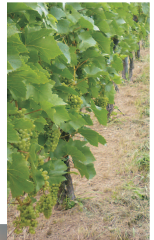
Oben: Arbeitsergebnis von Schwenscheibe und Stockputzer Links: Messerkreisel in Schwenscheibe

Folgende Ausführungen sind erhältlich (Auszug):