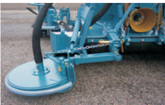
Oben: Aufhängung von Schwenscheibe Unten: Frontalansicht Mulchgerät von Schlepper aus gesehen

Die an beiden Seiten angebrachten Schwenscheiben sind sehr leichtgängig und haben eine große Ausweichmöglichkeit, auch nach oben. Sie mähen das Gras zwischen den Stöcken und schwenken am Rebstamm entlang, ohne den Stamm zu beschädigen.